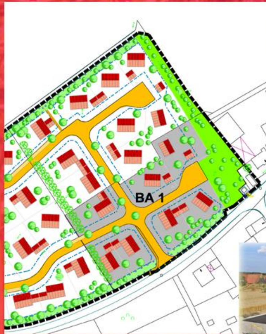
Das erschlossene Baugebiet